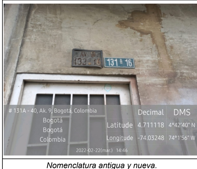
Nomenclatura antigua y nueva.